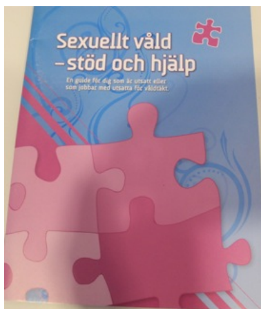
Operation kvinnofrid 2007

Många professionella och andra som möter misshandlade kvinnor frågar sig varför den våldsutsatta stannar kvar med förövaren. I denna bok vänder författarna på frågan och undrar i stället: Varför går hon? Genom teoretiska reflektioner och djupintervjuer med våldsutsatta kvinnor visar författarna på det traumatiska band som knyter kvinnan till den våldsamma mannen. Ett psykologiskt band med flera enskilda trådar som inte enkelt låter sig lösas upp.